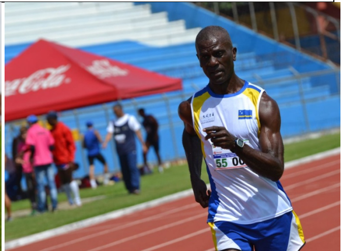
Central American Championship, San Pedro Sulas, Honduras, 2015—racewalk San Pedro Sulas, Honduras, 2015—caminata