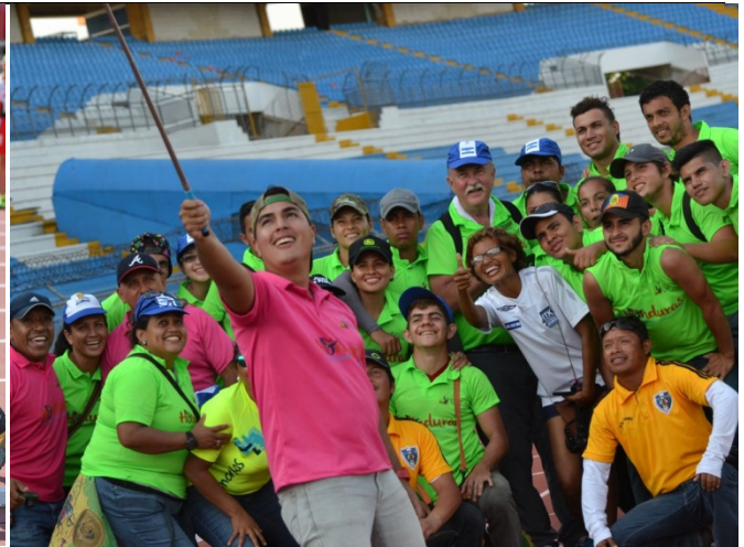
NCCWMA Championship 2017, Toronto, Canada